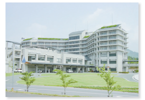
ほうじょうしげふみ

地域の急性期医療を担う中核病院です。医療福祉建築賞を受賞した建物で、その美しさに癒やされます。豊かな自然はもちろん、ショッピングなど生活環境も比較的充実しています。