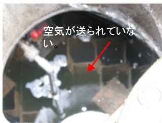
ブローヤ停止による機能不全

不適正な浄化槽(これらの状態は、悪臭や汚濁負荷の高い汚水の放流、地下浸透による汚染の原因になります。)