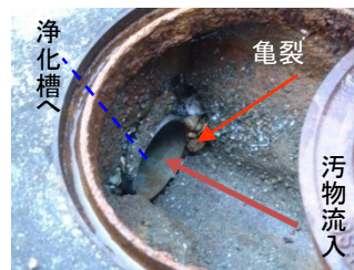
流入管の亀裂による汚水の地下水汚染