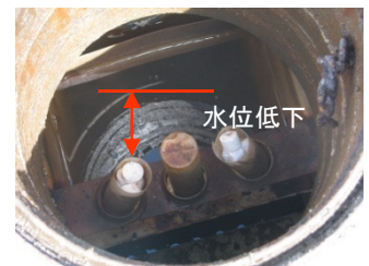
浄化槽本体からの漏水による地下水汚染