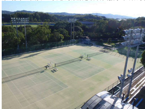
高知県・都市公園安全・安心対策緊急総合支援事業(春野総合運動公園) 高知県・都市公園安全・安心対策緊急総合支援事業(春野総合運動公園)