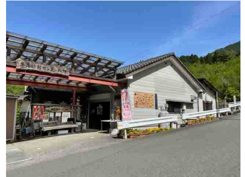
ふれあいの里柳野 (活動拠点の一つ)