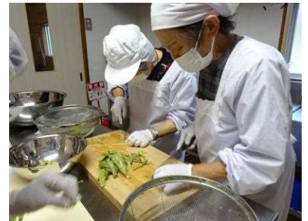
イタドリの加工品試作