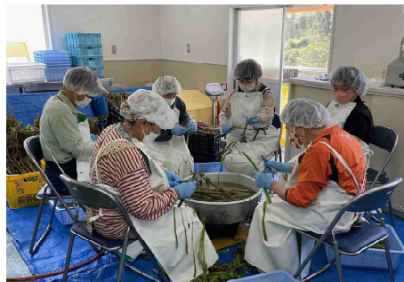
イタドリの一次加工