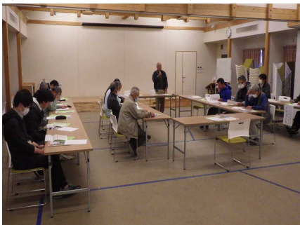
「トピアとかの」全体会