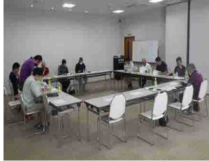
飼料用米研修 (愛媛県大洲市)