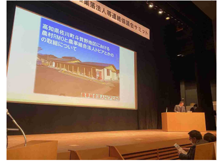
5県集落営農法人サミットで 活動発表 (島根県益田市)