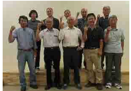
トピアとかの設立総会