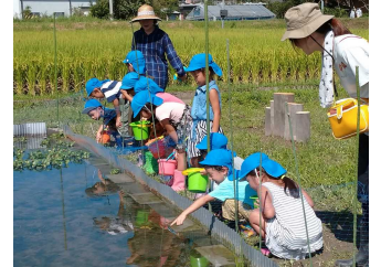
ビオトープでの体験学習