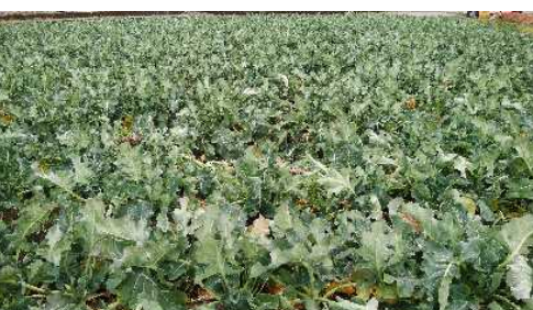
水稲後作のブロッコリー