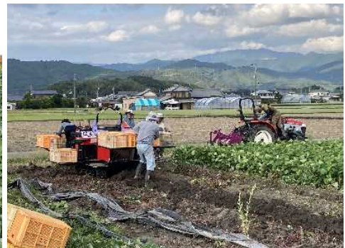
機械を使ったカンショの収穫作業