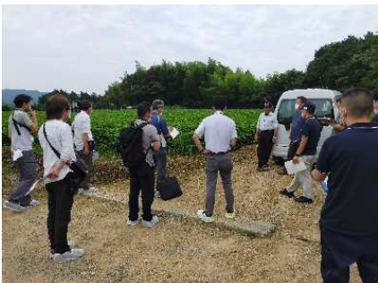
露地野菜の先進地視察(大月町)