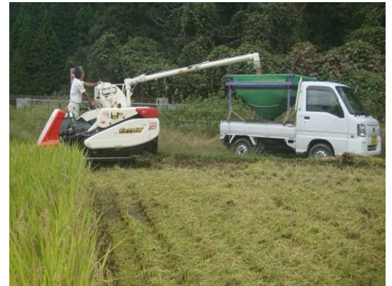
事業導入のコンバインで収穫