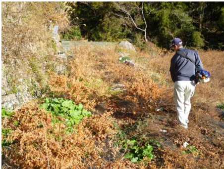
イタドリの刈り捨て作業