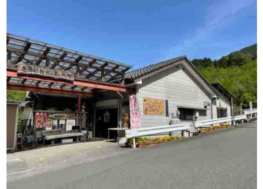
ふれあいの里柳野 (活動拠点の一つ)