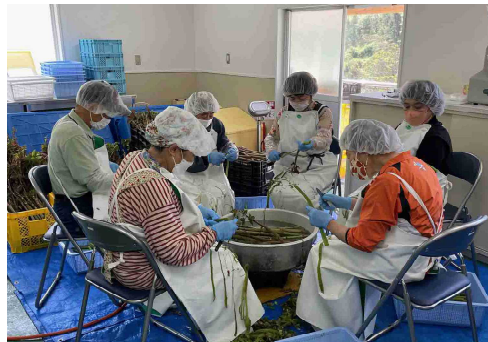
イタドリの一次加工