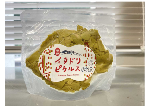
イタドリピクルス