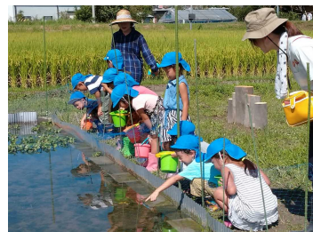
ビオトープでの体験学習