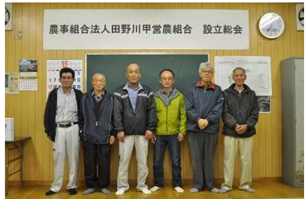
(農) 田野川甲営農組合設立総会

作業受託 ( 畦塗10a、耕耘30a、田植100a 収穫10a、乾燥10a、籾摺558袋、育苗548枚 )