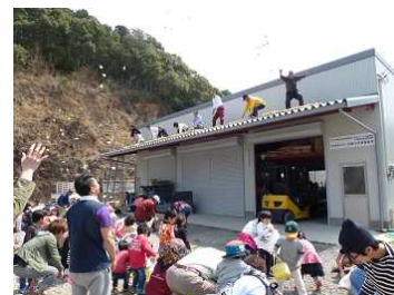
地域貢献の餅投げ