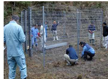
鹿の捕獲檻の設置