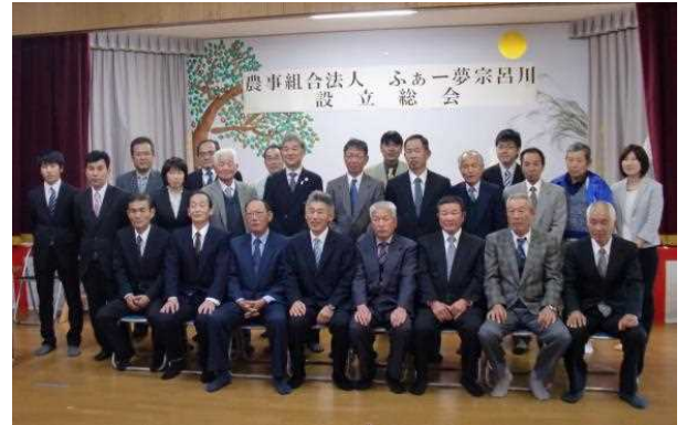
（農）ふあー夢宗呂川設立総会

育苗：32枚 田植え：30a 糶摺り：155袋 色選：165袋 ドローン防除：83.2ha