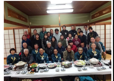
宗呂川地域意見交換会