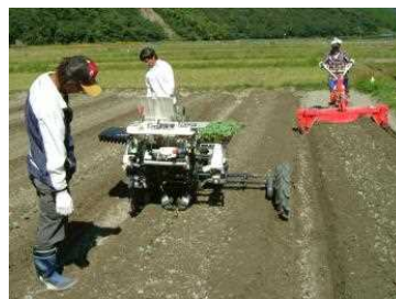
ブロッコリー栽培(移植作業)