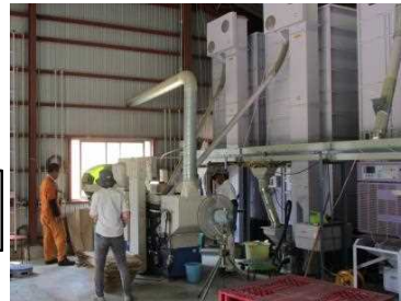
ミニライスセンター