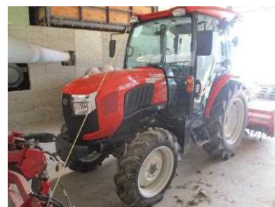
大型機械の導入(トラクター)