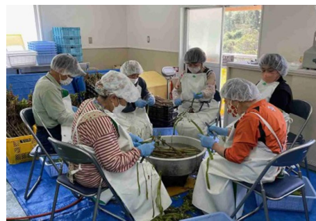
イタドリの一次加工