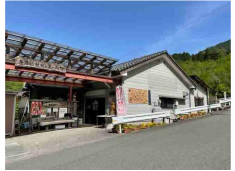
ふれあいの里柳野 (活動拠点の一つ)