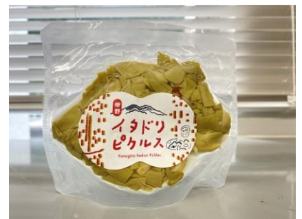
イタドリピクルス