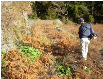
イタドリの刈り捨て作業