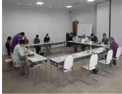
飼料用米研修 (愛媛県大洲市)