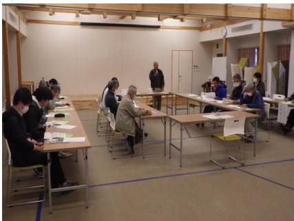
「トピアとかの」全体会