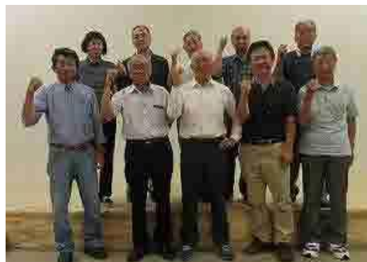
トピアとかの設立総会