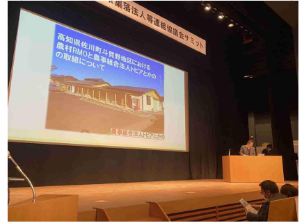
5県集落営農法人サミットで 活動発表 (島根県益田市)