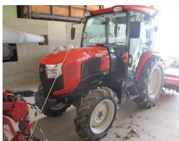
大型機械の導入(トラクター)