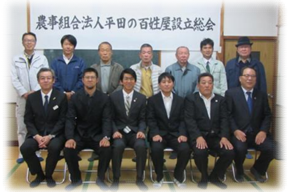
（農）平田の百姓屋設立総会

〔 主食用米 7.9ha、飼料用米 8.2ha 〕 〔 WCS 1.1ha、その他 1.8ha 〕