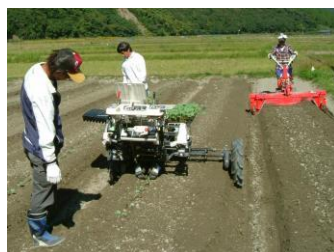
ブロッコリー栽培(移植作業)