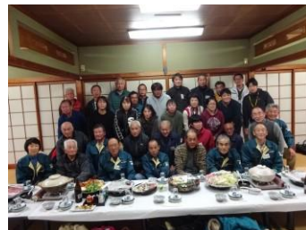
宗呂川地域意見交換会