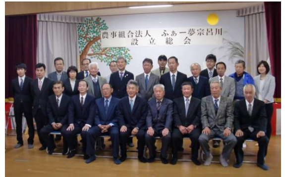
（農）ふぁー夢宗呂川設立総会