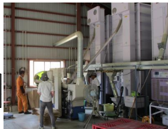
ミニライスセンター