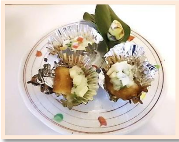
1人分の野菜摂取量