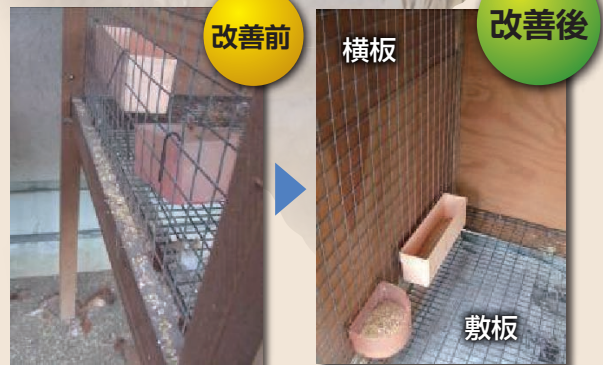
写真3 板を使った餌の散乱防止