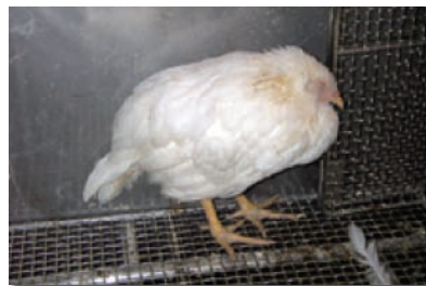
写真2 感染し、元気をなくした鶏