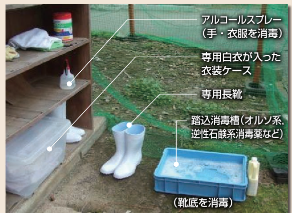
写真4 人を介したウイルス侵入対策