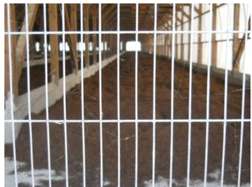
幅の狭い金網で小型鳥類の侵入を防止している例