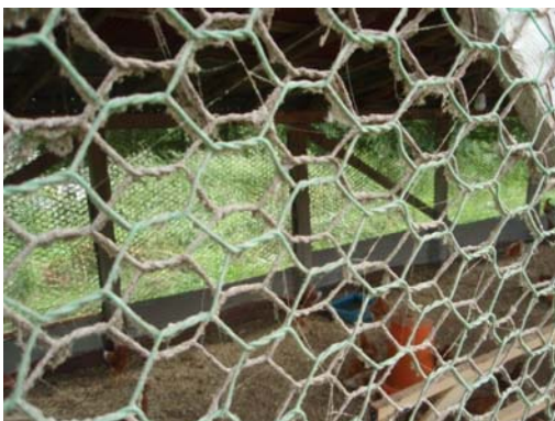
網目2cm以上のネットを二重にしている例

A. 屋外の運動場も含め、飼養する区域全てを防鳥ネットでカバーすることが難しい場合でも、家きん舎や給餌・給水場所には防鳥ネットを設置するなどして、野鳥等との接触の可能性を最小限にしてください。