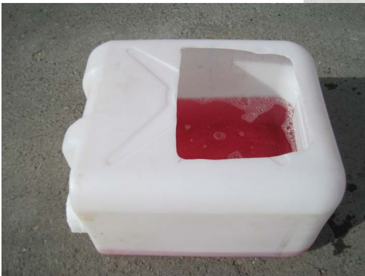
ポリタンクを改良した長靴用消毒容器