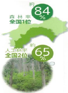
高知県の人工林の齢級配置