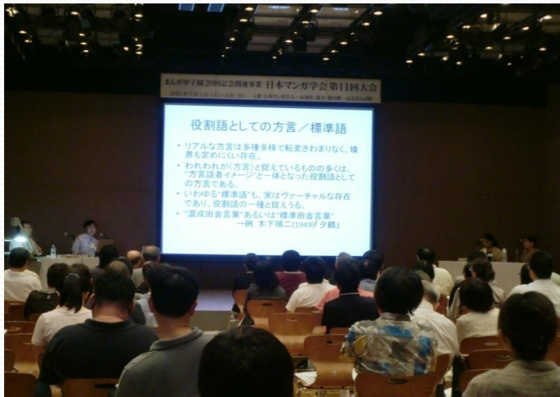
・マンガ学会高知大会の様子