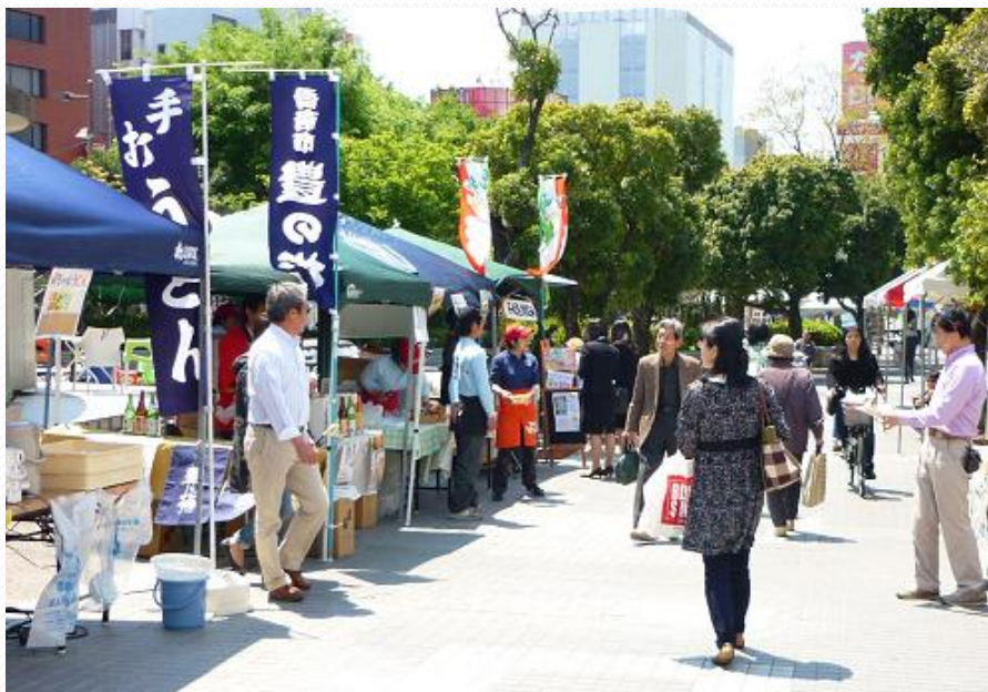
・ えいもんこじゃんと市の様子