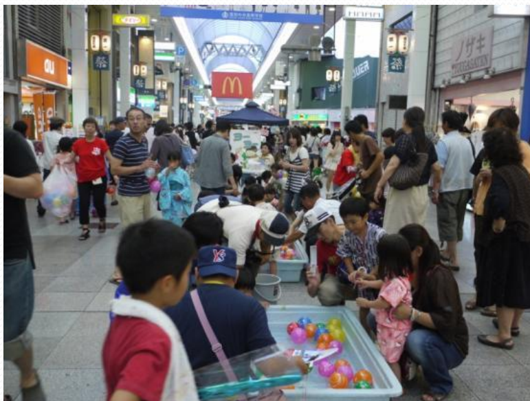
・土曜夜市の様子