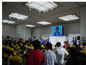
・ 敗者復活戦の様子