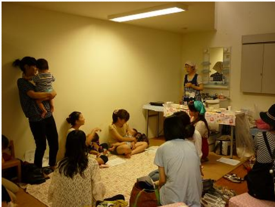
・ママズカフェの様子