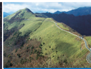
町道瓶ヶ森(UFOライン)