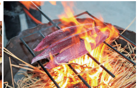
カツオ藁焼きタタキ