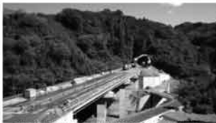
四国横断自動車道 片坂バイパス (黒潮町)