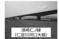
須崎仁ノ線 (仁淀川河口大橋)