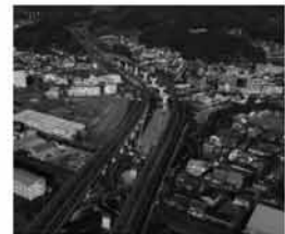
高知東部自動車道 高知南国道路 (高知市)