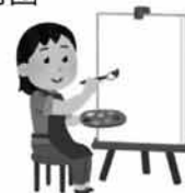
(文化生活部 文化推進課)

委託内容：①文化芸術支援事業 ②人材育成事業 ③情報発信事業 委託先：(公財)高知県文化財団 委託方法：随意契約