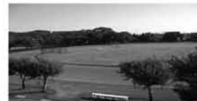
(教育委員会 生涯学習課)