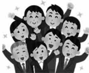
(地域福祉部 少子対策課)