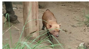
(参考)京都市動物園