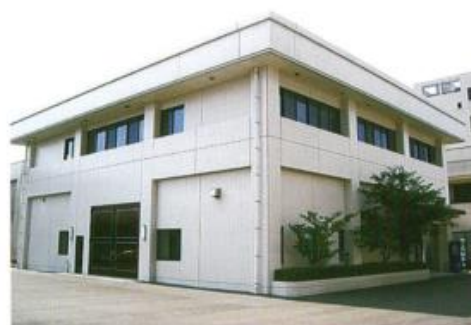
企業化支援センター外観