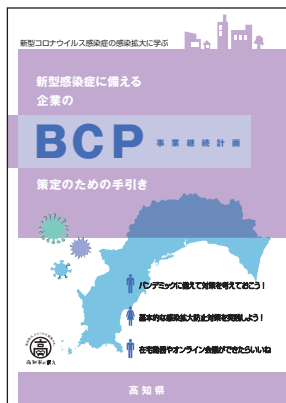
『新型コロナウイルスBCP策定の手引き』(作成中)

高知県は、新型コロナウイルス対応の「BCP策定のための手引き」「ひな形」を作成いたします。本講座は、この新しい資料を使用して、県内企業の皆さまが、新型コロナウイルス対応のBCPを策定されるのをお手伝いいたします。(令和3年9月末完成予定)