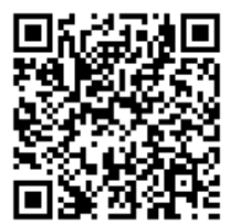
ニュースレター 配信登録用QRコード

17WCEE事務局 日本コンベンションサービス(株) 〒100-0013 東京都千代田区霞が関1-4-2 大同生命霞が関ビル14階 E-Mail: 17wcee@convention.co.jp URL : www.17wcee.jp