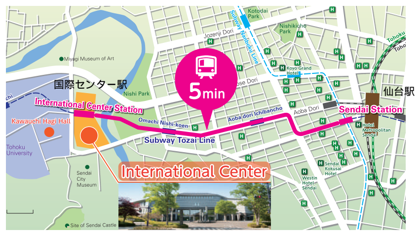
仙台国際センター 仙台市営地下鉄 東西線 国際センター駅より徒歩1分