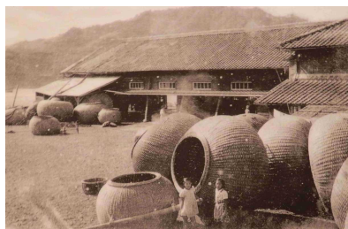
イワシのイケスカゴ(中土佐町久礼)