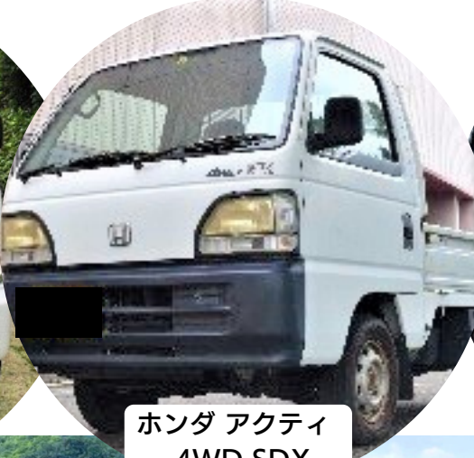
ホンダ アクティ 4WD SDX 166,000円