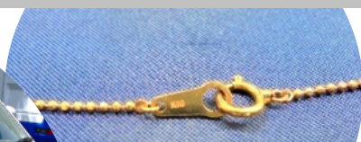
ネックレス 2点セット 14,000円