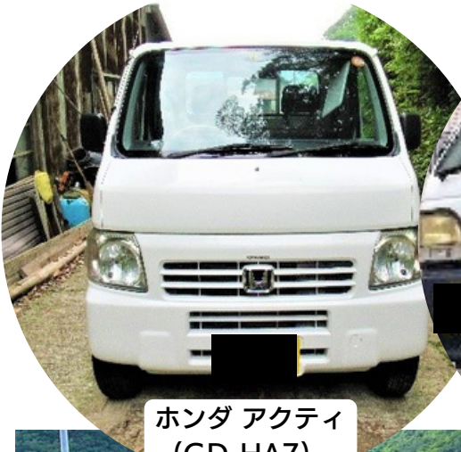
ホンダ アクティ (GD-HA7) 10,200円