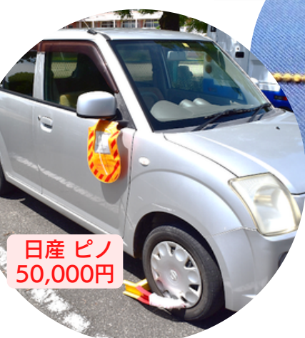
日産 ピノ 50,000円