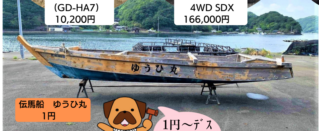
伝馬船 ゆうひ丸 1円