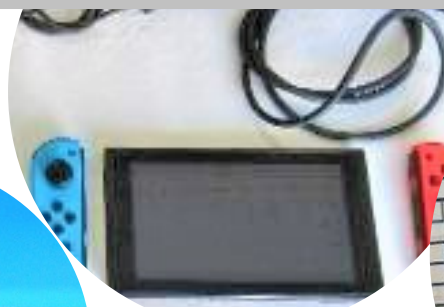
Nintendo Switch 24,000円