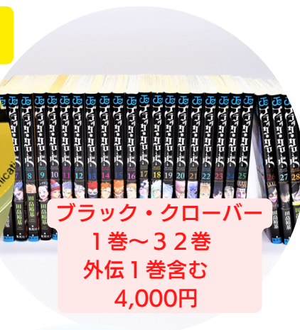
ブラック・クローバー 1巻~32巻 外伝1巻含む 4,000円