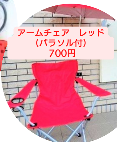
アームチェア レッド (パラソル付) 700円