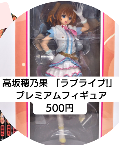
高坂穂乃果「ラブライブ!」 プレミアムフィギュア 500円