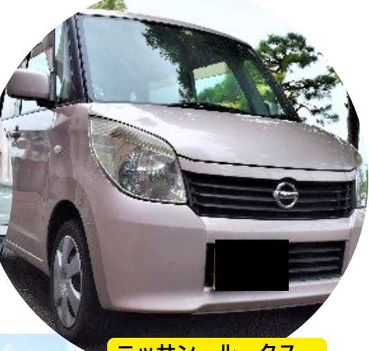
ニッサン ルークス 113,000円