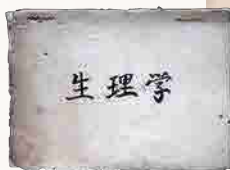
2 女子医専の専任教授 下司孝磨氏による生理学の講義ノート(左) 昭和21年度高知県立女子医学専門学校入試問題(右)