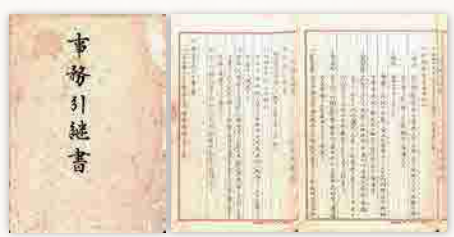
1 昭和20年11月知事引継書 昭和20年6月の高知市空襲により校舎が全焼したため佐川青年学校での開校となったことが記録されている。