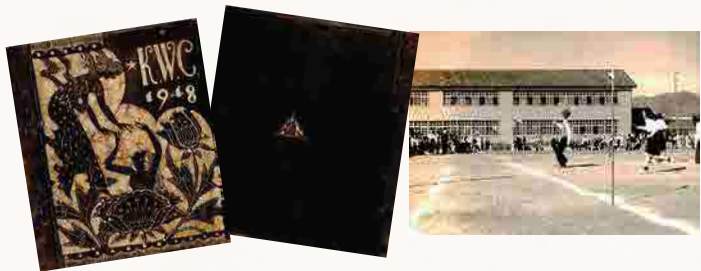
4 女子専門学校アルバム、運動会の様子 表面には「KWC」の文字、裏面には校章であるロゴが刻まれている。