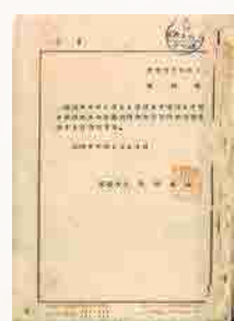
5 女子専門学校廃止認可書 昭和27年4月16日付で文部大臣より女子専門学校の廃止が認可された。