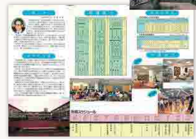
9 高知短期大学案内(平成元年度)