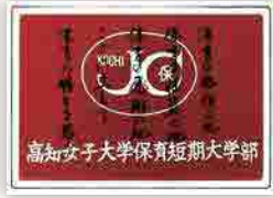
10 平成10年閉学時に作成された記念アルバム