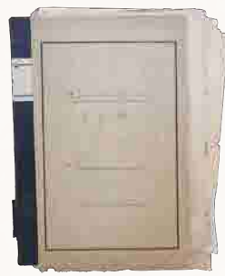
7 高知女子大学を守る会ノート(左) 高知女子大学を守る会規約(右)