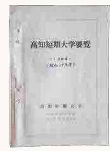
8 高知短期大学要覧(昭和39年度)