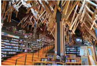
梶原町立図書館(雲の上の図書館)