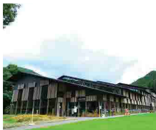
梼原町立図書館(雲の上の図書館)