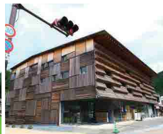
まちの駅「ゆすはら」(マルシェ・ユスハラ)