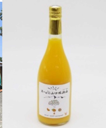
写真 左：ヤ・シ土産物店 右：山北みかんジュース（山北みらい）