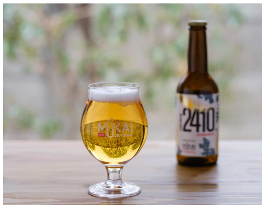
写真 左：Mukai Craft Brewing 右：クラフトビール（BLUE BREW）