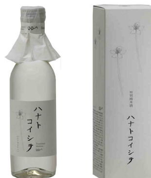
写真 左：酒ギャラリーほてい 右：ハナトコイシテ（司牡丹）