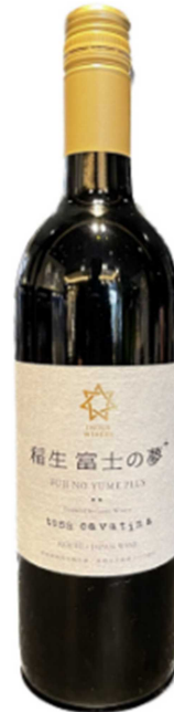
写真：左：井上ワイナリーのいち醸造所 右：tosa cavatina（井上ワイナリー）