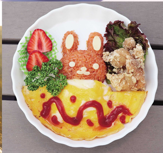
日高村のオムライス