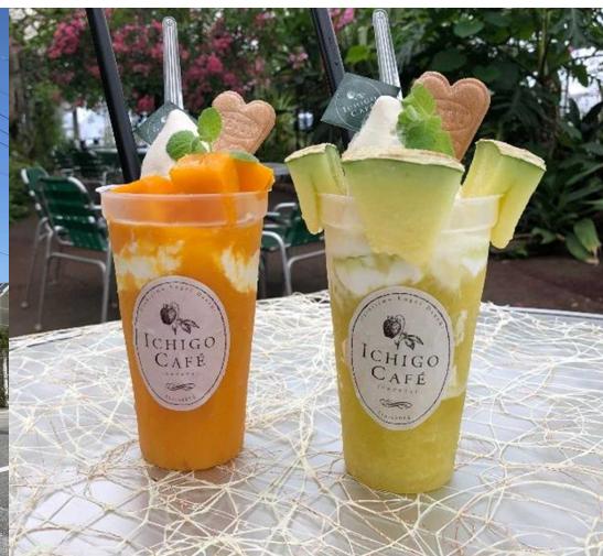
写真 左：西島園芸団地 右：スムージー（西島園芸団地）