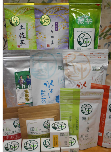
写真 左：村の駅ひだか 右：「土佐茶」（霧山茶園）