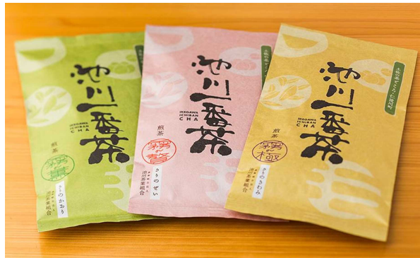
写真 左：池川茶園工房カフェ 右：煎茶（池川茶園）