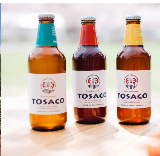
写真 左：TOSACO TAP STAND 右：クラフトビール（TOSACO）