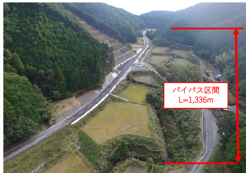
かめのかわ 亀ノ川バイパス (令和5年7月29日供用開始予定) (H25～R5)