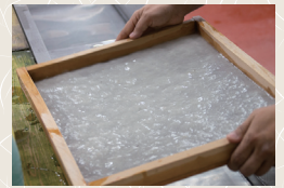
土佐和紙紙すき体験