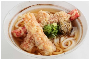
かにっちょくわうどん