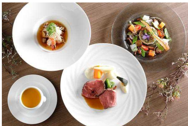
「高知県フェア」ランチコース