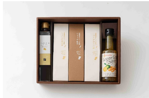
4等 高知県産品ギフト