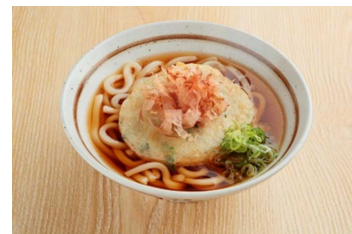
ねぎ天うどん(一部店舗)