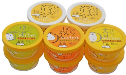
アイスクリンと柑橘シャーベット