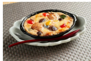
四万十鶏つみれのグラタン