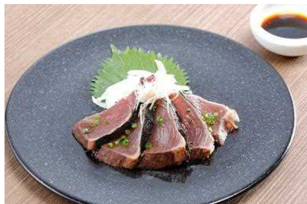
高知県産 鰹のタタキ 四川ピリ辛ガーリックソース