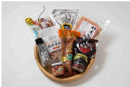
3等 高知県産品ギフト