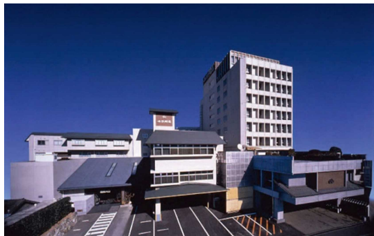
1等 土佐御苑ペア宿泊券