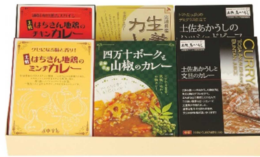
土佐のカレーセット