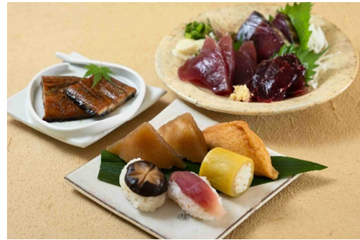
2等 高知県産品ギフト