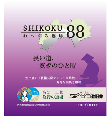
高知 長い道、寛ぎのひと時