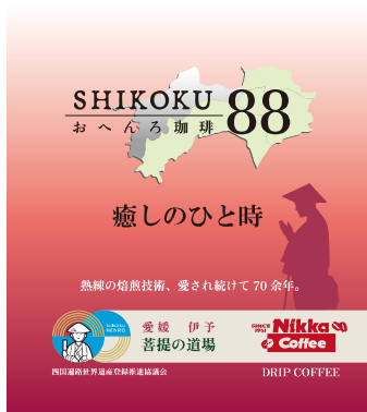
愛媛 癒しのひと時