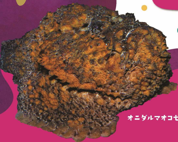
オニダルマオコゼ

Kochi's POISON exhibition in SATOUMI 2024