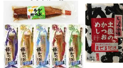
姫かつおスティック