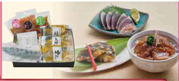
きたてえ高知から。 ㈱カネアリ水産

高知の企業同士でコラボすることで「高知を盛り上げたい!」という思いから、酔鯨の酒粕を使用したプリンの開発を行いました。完成した「甘酒プリン」は、まるでクリームチーズのような濃厚な味わいで、後味には優しく甘い酒粕の風味がほんのり漂います。さらに「高知の呑兵衛流」として、プリンに日本酒を注いで楽しむことをご提案しております。新感覚の大人デザートとして、高知のみならず日本各地にお届けし、大変好評いただいております。