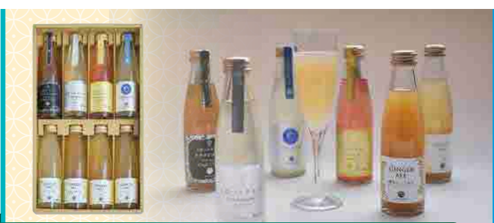
土佐プレミアムスパークリングセット ㈱スタジオオカムラ

高知を代表する温州みかんの産地、香南市香我美町「山北」。この地で栽培されている「山北みかん」の果汁を搾った「やまきたみかんジュース」と、その果汁のみを使って井上ワイナリーが醸造した「山北みかんワイン」。どちらも「山北みかん」果汁だけでつくった地元高知産のドリンクです。「山北みかんワイン」は地域連携の取り組みが評価されて「令和5年度第38回高知県地場産業大賞」の「高知県地場産業賞」を受賞しました。