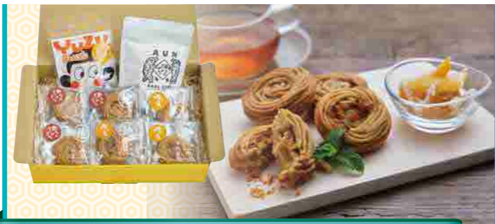
馬路×四万十 あうんギフト

土佐清水市の特産品「土佐宗田節」は製造量日本一を誇ります。令和5年度文化庁「100年フード」に認定され、有識者特別賞を受賞するなど、その濃厚な味わいと風味は最高級品として高く評価されています。宗田節は疲労回復効果の期待されるタウリンやプロテインが豊富で低カロリーな食材です。土佐清水市の人気キャラクター「宗田ぶっしー君」が筋トレの際に欠かせない宗田節の人気商品をセットにしました。