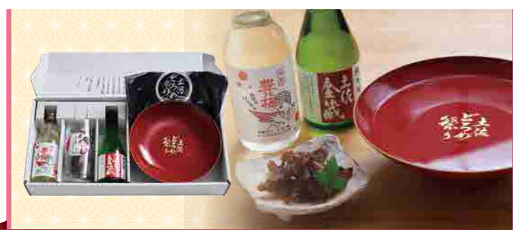
出張どこでも「どろめ祭り」 ㈱東武

「地元の新鮮な魚を全国の皆様にも食べてほしい!」「四国一小さな町にこんなにおいしい魚があることをもっとをみんなに知ってほしい!」「四季折々のこの海の豊かさを、魅力を全国に伝えたい!」そんな気持ちでつくったギフトセットは、弊社の一番の人気商品のカツオのタタキ、そしてたった2カ月で1万食売れた魚屋の漬け丼シリーズ、新商品となる西京漬けをセットにしました。箱の裏面には高知県の高校生が書いた高知県のさかなのイラスト。全てが、made in Kochi。高知クオリティです。