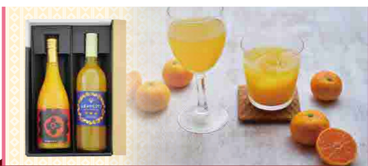
山北みかん ワイン&ジュース ギフトセット 井上ワイナリー(株)

2024年、城西館は皆様を支えられ創業150周年を迎えることができました。150周年を記念して開発された「土佐ゆずゴーフル」「銀不老黒糖ドーナツ棒」や、定番人気の「銀不老かりんとう」も盛り込んだセットをご用意しました。県内各地の特産品の味を活かした、バラエティ豊かな商品をお楽しみいただけます。