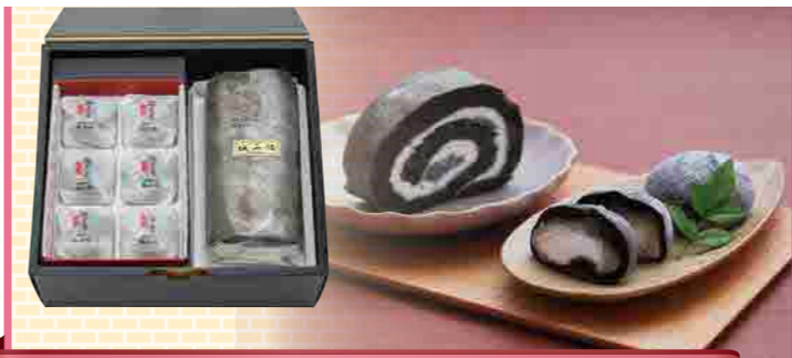
創業明治7年 城西館 銀不老大福&銀不老ロールセット

高知の東にある馬路村と、西にある四万十町。中山間地域ですが「あうん」の呼吸でつくったギフトBOXができました。馬路村と四万十町がコラボした希少な国産紅茶、「あうんアールグレイ」とお菓子のセットです。大切な贈り物におススメです。