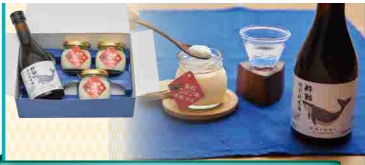
呑兵衛さん必見!酔鯨の酒粕を使った「甘酒プリン」&酔鯨 特別純米酒セット

鰹タタキは全国ネットテレビ番組内の「高知県アンテナショップ人気BEST5」にて堂々の1位を獲得した完全薫焼き龍馬タタキ。土佐めたは全国調味料選手権2015にて審査委員長特別賞を受賞した薬にんにくジェノバペースをベースに、イタリアンの巨匠 奥田政行シェフの指導により軽用が開発された品で、高知家のうまいもの大賞2023年最優秀賞を受賞。そのコンクールでの最終審査の勝負レシピが当商品の組み合わせであり、そちらを今回お洒落なギフトセットにしました。