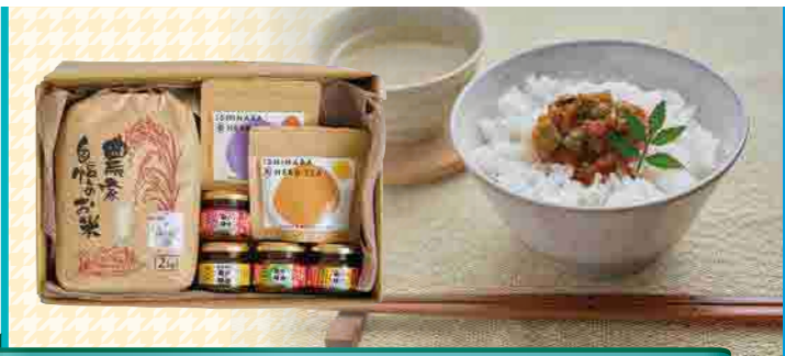
『おいしい!』は土佐の山間より 元気モリ(森)モリ(森)山の恵みセット

高知県大豊町でのみ生産される希少な豆・銀不老豆の粉末を使用したオリジナル冷凍スイーツを詰めあわせました。JAL国内線ファーストクラス機内食で提供された銀不老大福は、クリームと白あんで仕上げたまろやかな食感が人気。城西館の喫茶せせらぎでもお召しになれる銀不老ロールはパティシエ手作りの逸品です。ご自宅用にも、手土産にもおすすめです。