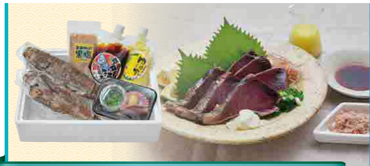
塩も!タレも!鰹タタキ食べ比べ2節セット

高知県の山間地にある人口300人足らずの「いしはらの里」。この自然豊かな土地には澄んだ水と空気があり、『おいしい』が育ちます。農家さんが丹精込めて育てた野菜たっぷりの山の辣油、寒暖差によりうまみが凝縮した地元のお米、香り広がるイチョウや柿の葉の和ハーブティーのセットはみなさんを元気にします。このギフトセットを通じて日本の「地域」の素晴らしさを伝えたい。地方が元気になるればきっと日本も元気になる!!