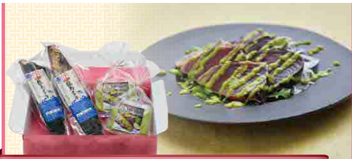
大賞W受賞鰹タタキと土佐めたギフトセット

鰹のタタキを、定番のたれで食べるか、ツウの塩で食べるか。どっちも楽しみたい!の気持ちにこたえて、食べ比べせつとが新登場!塩にもこだわり、スタッフ一同納得のいくまで試食。タタキの味を引き立ててくれる「黒塩」を選びました。塩=白色の概念を覆し、なおかつ黒潮と共に北上南下する鰹にかけたセットです。タタキ2節に、手作りたれ、薬味、高知県産柚子酢、黒塩がつき、タタキを切れば、すぐにお召し上がりいただけます。