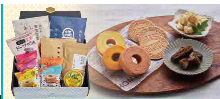
創業明治7年 城西館オリジナルギフトセット

今や全国区の知名度となった高知県の「奇祭」香南市のどろめ祭り。その祭りのメインイベント「大杯飲み干し大会」は男性一升・女性半升を速さだけでなく飲みっぷりの良さを競うユニークな大会。そんなイベントをご家族・友人等とご家庭で体験してみませんか?大杯にジュースを入れたら子供も楽しめます! ※この商品は大会の雰囲気を楽しんでもらう為のものです。アルコールの酔い等は絶対にしないようお願い致します。