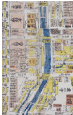
京都府管内地図 土佐藩邸付近