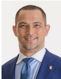
スポーツ庁長官 室伏 広治