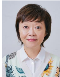
スポーツジャーナリスト 大阪芸術大学教授 増田 明美 氏