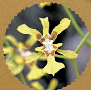
オンシジウム・オプリサトゥム