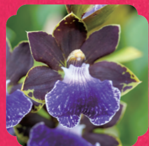
ジゴベタルム属の園芸品種