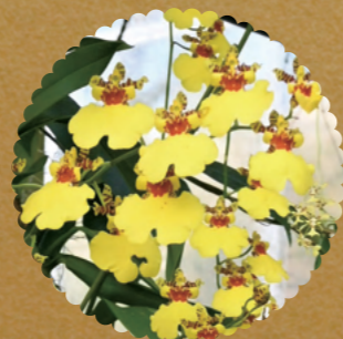
オンシジウム・アロハ・イワナガ

高知には「おきやく」と呼ばれる独特の酒宴文化があります。ランでこしらえた花皿鉢®で、当園らしい「おきやく」の雰囲気をお届けします。