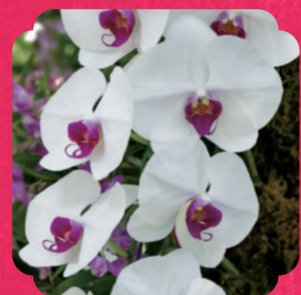
コチョウラン属の園芸品種

夏の高知を華やかに盛り上げるよさこい祭り。 色彩豊かなランで演出するよさこいが、 冬のラン展を盛り上げます。