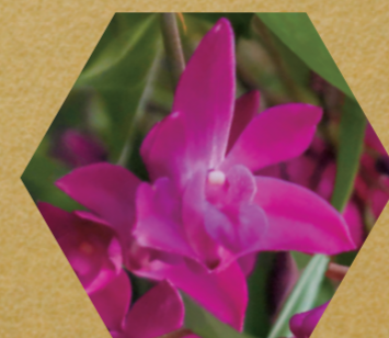
デンドロビウム・キングアナム

土佐備長炭の硬質な黒とデンドロビウム属のランの鮮やかな赤の対比が、独特の空間を生み出します。一風変わった趣を味わってみては?