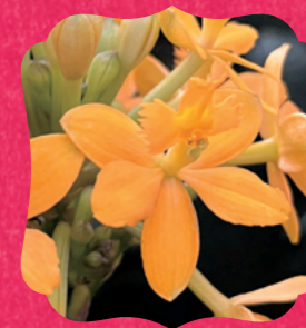
エビデンドルム属の園芸品種

高知には「おきやく」と呼ばれる独特の酒宴文化があります。ランでこしらえた花皿鉢®で、当園らしい「おきやく」の雰囲気をお届けします。