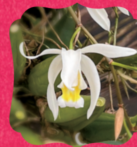
セロジネ・インターメディア