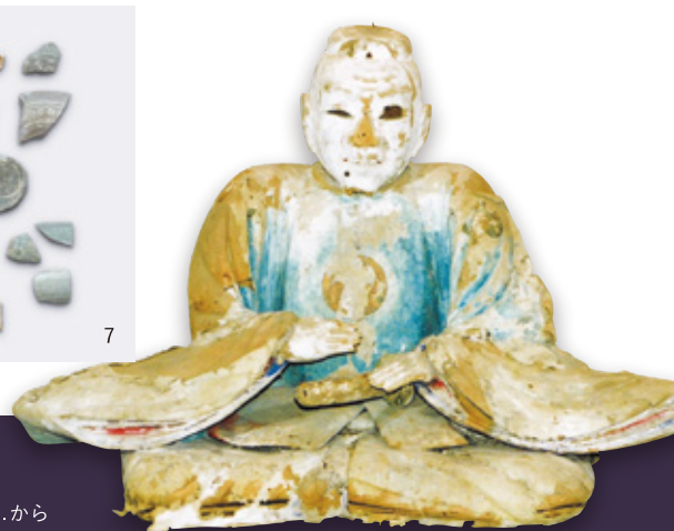
西園寺公広坐像 西予市光教寺蔵(愛媛県歴史文化博物館管理)