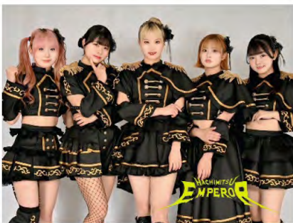
蜂蜜★皇帝(はちみつエンペラー)