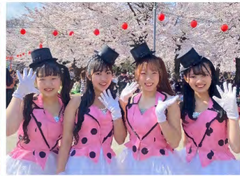
みちのく仙台ORI☆姫隊