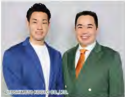
2025年5月28日(水) 13:00～/16:00～ 出演予定：ミルクボーイ他

実力派芸人がおもしろおかしく「笑いのチカラ」で地方創生SDGsをお届け、応援します！