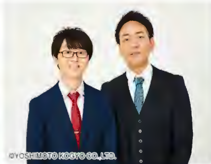
2025年5月31日(土) 14:00～ 出演予定：スーパーマラドーナ 笑い飯、男と女