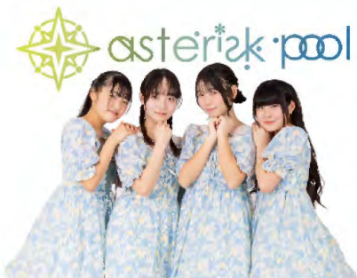
asterisk pool (アスタリスク プール)