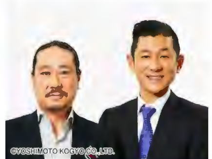
2025年6月1日(日) 14:00～ 出演予定：笑い飯、ギャロップ ナイチンゲールダンス