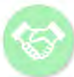
地方創生SDGs 官民連携プラットフォーム