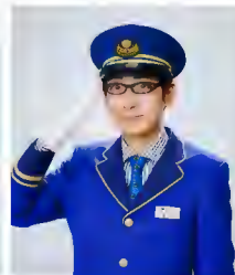
吉川正洋 (ダーリンハニー)