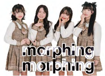
morphing×morphing (モーフィン モーフィン)