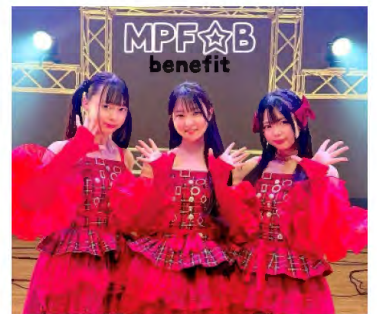
MPF☆B(エムピーエフビー)