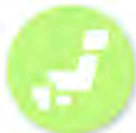
SDGs未来都市 自治体SDGsモデル事業

内閣府では、地方創生SDGsの推進に当たり、「SDGs未来都市・自治体SDGsモデル事業等」の選定、「地方創生SDGs官民連携プラットフォーム」の運営、「地方創生SDGs金融」の推進などに取り組んでいます。