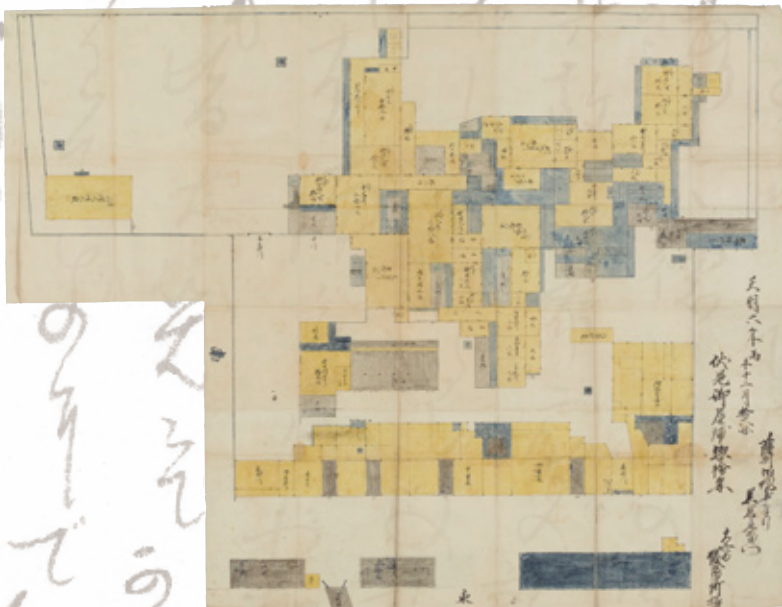
寺田屋遭難後に龍馬が匿われた薩摩藩伏見屋敷の絵図