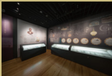
ジョン万次郎展示室