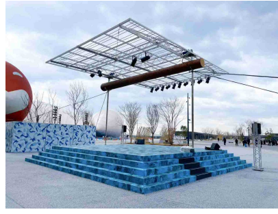
【ポップアップステージ西】