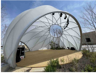
【ポップアップステージ東外】

メイン会場となる EXPO アリーナ「Matsuri」以外に、東ゲート付近にあるポップアップステージ東外及び西ゲート付近にあるポップアップステージ西でもよさこいの演舞と各市町村の PR を行います。これらの会場は、万博のシンボルでもある大屋根リングのすぐそばなので、気軽に観覧いただけます。