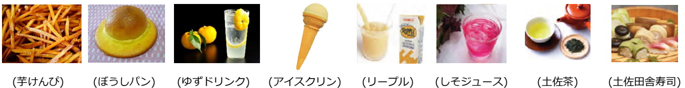
(芋けんぴ) (ぼうしパン) (ゆずドリンク) (アイスクリン) (リープル) (しそジュース) (土佐茶) (土佐田舎寿司)