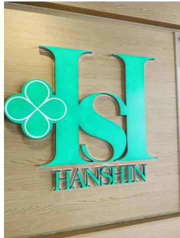
新店舗を出店する「阪神百貨店梅田本店」