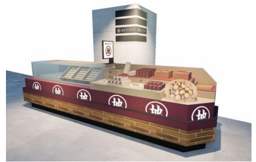
四万十ドラマ 阪神梅田店 店舗イメージ

URL： https://www.hanshin-dept.jp/hshonten/index.html