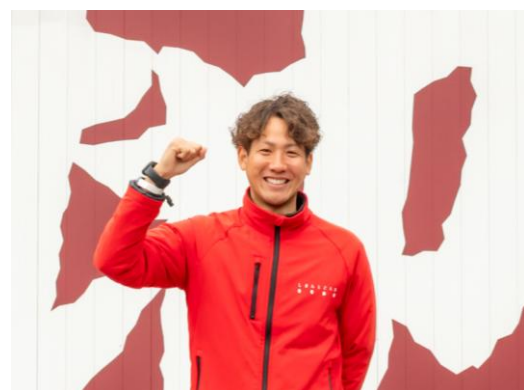
四万十ドラマ 阪神梅田店を愛されるお店に！

そして今回、31年目を迎えるこのタイミングで、阪神百貨店様に出店させていただき運びとなり、新たな、そしてとても大きな挑戦として意気軒昂しております！新店舗「四万十ドラマ」では、四万十の恵みに育まれた「しまんと地栗」、サツマイモの「人参芋」、四万十のお茶などの産物を大阪でも味わっていただけるよう山の上からお届けします。高知・四万十の小さな地域にある会社ですが、地域の可能性をたくさんのお客様に知っていただき、喜んでいただけるように努めてまいりますので、お引き立て頂きますようお願い申し上げます。