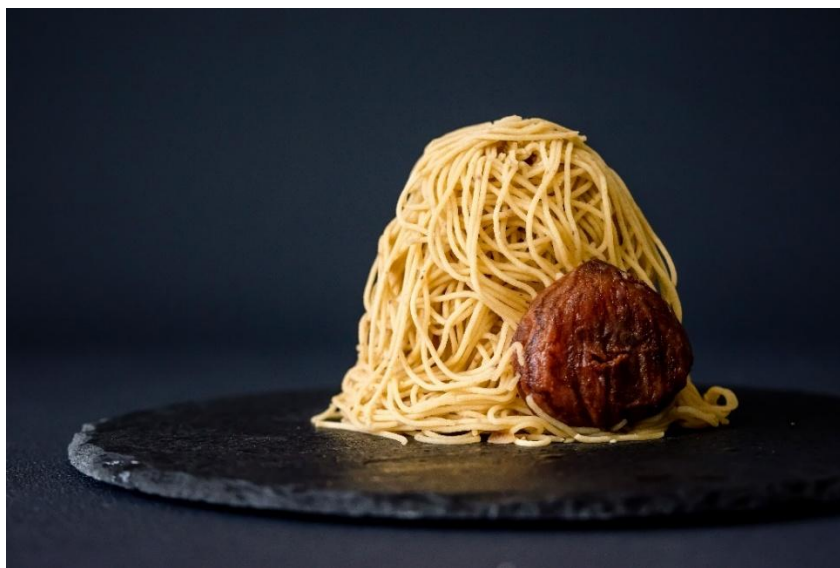
栗と砂糖だけの栗ペーストを 1 ミリで絞った「プルミエモンブラン」

高知県四万十町産「しまんと地栗」が主役の、濃厚栗スイーツ専門店が大阪初上陸！ 土佐のおきやく魂をのせた“祝オープン記念セット”(数量限定)も販売予定